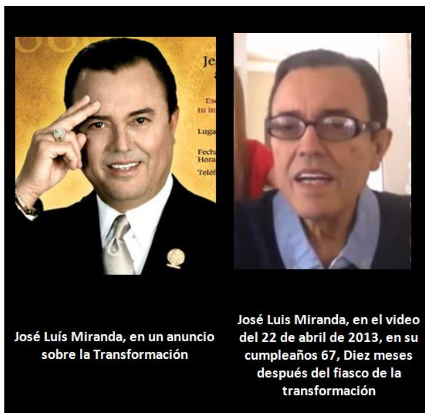
Figura 2. La “transformación” de José Luis de Jesús Miranda.

razón por la cual no atendía a la prensa. Sin embargo, sus fieles decían que José Luis les había dado la sabiduría para apartar con el poder de su mente a cualquier enfermedad, pero él mismo no pudo despojarse de la suya, la cual poco a poco lo fue debilitando hasta que lo condujo a la muerte.